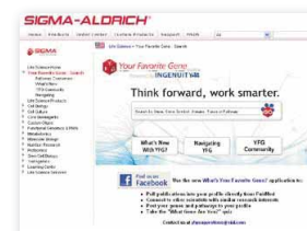
Page d'accueil de notre site YFG : sigma.com/yfg

Tous nos anticorps disponibles sont rigoureusement testés. Les performances établies pour chaque lot de fabrication ainsi que de nombreuses données complémentaires sont reportées sur nos fiches techniques et/ou certificats d'analyse. Les documents sont accessibles en ligne sur notre site internet sigma.com/antibody