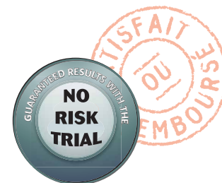
Notre offre exclusive Satisfaction Garantie TM