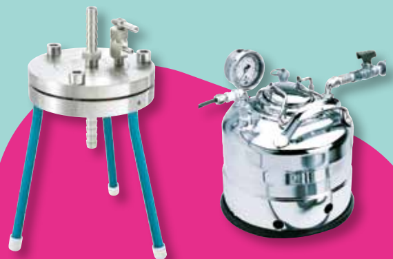
ステンレス製 90 mm フィルターホルダー