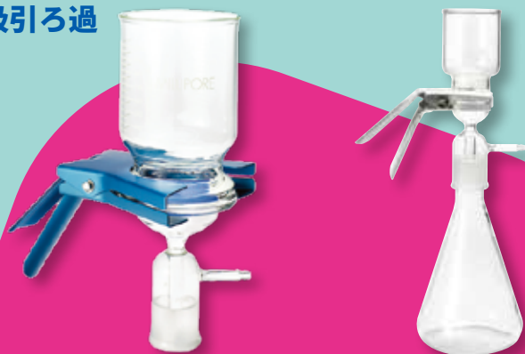
全ガラス製 90 mm フィルターホルダー ステンレススクリーン