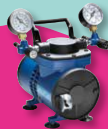
吸引ろ過、加圧ろ過両方に使用できる高性能ポンプ。 浸食性の薬品や溶媒にも対応しています。